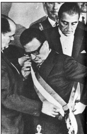
Salvador Allende es investido presidente de Chile (1970)

El 11 de septiembre 1 el Palacio presidencial está en llamas. Tres años antes, Salvador Allende, llevado al poder por una ola de entusiasmos sin precedentes, anunciaba a las masas reunidas su intención de conducir Chile al socialismo por vías democráticas y afirmaba que el camino más seguro hacia la revolución era la papeleta de voto. Durante tres años, como el pasado marzo y una vez más el 1 de septiembre, a la llamada de Allende, las masas salvaron, intentaron salvar su