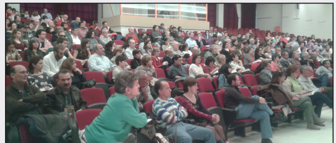
Viernes, 14 de marzo: Presentación del libro en la Facultad de Ciencias Económicas y Empresariales de UCM