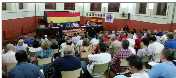
Conferencia Obrera Estatal del CATP - 27 de junio de 2015

Por ello compartimos la moción en apoyo del pueblo griego adoptada por la Conferencia Obrera Estatal del Comité por la Alianza de Trabajadores y Pueblos (CATP) del 27 de junio. La reproducimos íntegramente en esta Carta .