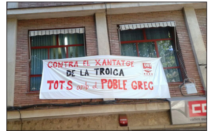
Esta mañana (28 de junio) la sede de la UGT de Sabadell lucía esta pancarta de apoyo al pueblo griego

Esta es la primera y más importante solidaridad con nuestros hermanos griegos, buscando el combate común para resistir juntos a los planes del capital, la Unión Europea, el FMI y los gobiernos a su servicio para allanar el camino a una verdadera UNIÓN LIBRE DE NACIONES Y PUEBLOS basada en la cooperación fraternal y liberada de toda explotación y opresión.