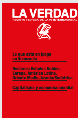
LA VERDAD 94-95 Revista teórica de la IV Internacional Precio 4€