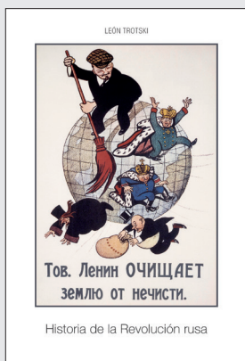
Historia de la Revolución Rusa León Trotsky Precio: 20€ (2 tomos)