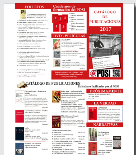
Catálogo de Publicaciones 2017

Consulta nuestro catálogo de publicaciones: http://posicuarta.org/cartashblog/wp-content/uploads/2017/07/Catalogo2017.pdf